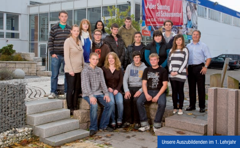
Unsere Auszubildenden im 1. Lehrjahr